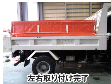
左右取り付け完了